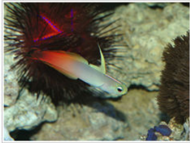
Le Guide Pratiche